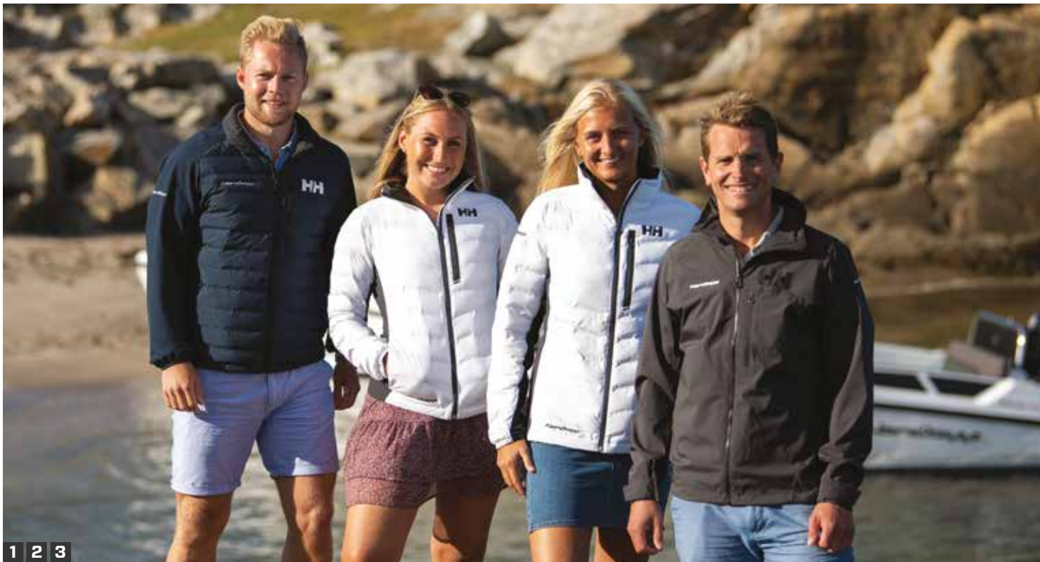
1 2 3